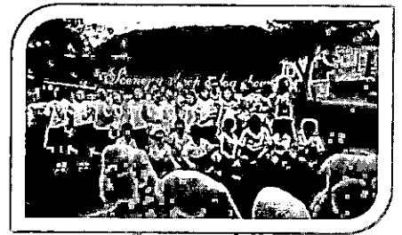
นักเรียนไปทัศนศึกษา และบันทึกวิถีโอเชิญชวนเที่ยวสวนผึ้ง

ผลการเรียนรู้ เรื่องข้อมูลท้องถิ่นราชบุรี หลังการจัดการเรียนรู้ตามหลักสูตร สูงกว่าเกณฑ์ร้อยละ 80 อย่างมีนัยสำคัญทางสถิติที่ระดับ .05 ทั้งนี้เนื่องจากเนื้อหาในหลักสูตรเป็นเรื่องที่ใกล้ตัวนักเรียน ได้เรียนรู้จากสภาพแวดล้อมจริงเป็นสื่อการเรียนรู้ที่มีอยู่ในท้องถิ่น โดยมีครูคอยแนะนำ ซึ่งสอดคล้องกับมาตรา 29 ให้สถานศึกษาร่วมกับบุคคล ครอบครัวยุวมชน องค์กรชุมชน องค์กรปกครองส่วนท้องถิ่น เอกชน องค์กรเอกชน องค์กรวิชาชีพ สถาบันศาสนา สถานประกอบการ และสถาบันสังคมอื่น ส่งเสริมความเข้มแข็งของชุมชนโดยจัดกระบวนการเรียนรู้ภายในชุมชน เพื่อให้ชุมชนมีการจัดการศึกษาอบรม มีการแสวงหาความรู้ ข้อมูล ข่าวสาร และรู้จักเลือกสรรภูมิปัญญาและวิทยาการต่างๆ เพื่อพัฒนาชุมชนให้สอดคล้องกับสภาพปัญหาและความต้องการ รวมทั้งหาวิธีการสนับสนุนให้มีการแลกเปลี่ยนประสบการณ์การพัฒนาระหว่างชุมชนกรมวิชาการ [7] สอดคล้องกับมาเรียม นิลพันธุ์ [8] ที่กล่าวว่า พิพิธภัณฑ์และแหล่งเรียนรู้ทั้ง 4 แห่ง ชุมชน