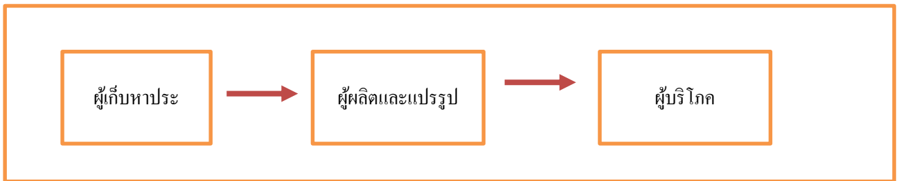
ภาพที่ 3 ลักษณะความสัมพันธ์ของการจัดการ โซ่อุปทานประและผลิตภัณฑ์ประ

ทั้งนี้รูปแบบลักษณะความสัมพันธ์ของการจัดการ โซ่อุปทานประและผลิตภัณฑ์ประ เป็นแบบเส้นตรง (Linear Supply chain)