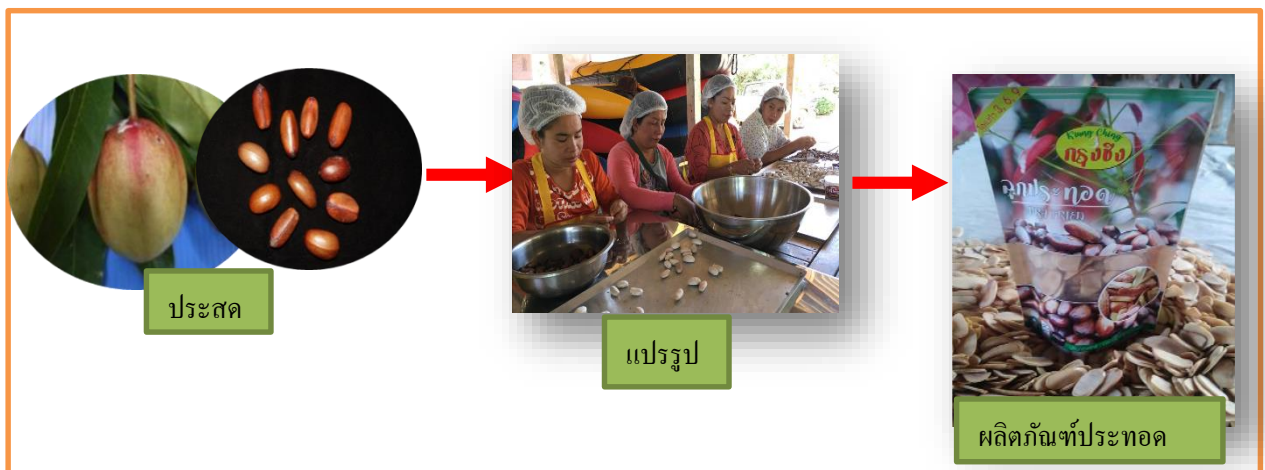
ภาพที่ 1 การแจกจ่ายวัตถุดิบประสดเข้าสู่กระบวนการผลิต

1. กิจกรรมภายใน (Inbound Logistics) เมื่อทางกลุ่มวิสาหกิจชุมชนได้รับคำสั่งซื้อจะทำการจัดหาวัตถุดิบการจัดเก็บและการแจกจ่ายวัตถุดิบเข้าสู่กระบวนการผลิต สามารถแสดงดังภาพที่ 1