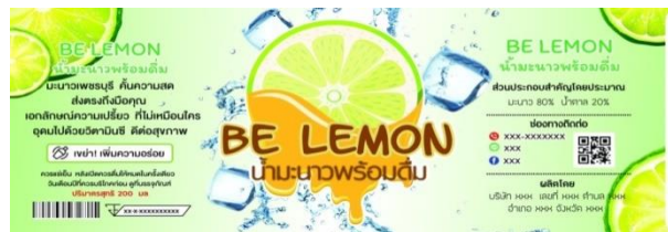
ภาพที่ 4 ต้นแบบฉลากผลิตภัณฑ์แปรรูปน้ำมะนาวพร้อมดื่ม ในจังหวัดเพชรบุรี

จากการเก็บรวบรวมข้อมูล การศึกษาพฤติกรรมและความต้องการ นำไปสู่การพัฒนารูปแบบผลิตภัณฑ์ต้นแบบผลิตภัณฑ์แปรรูปน้ำมะนาวพร้อมดื่ม ผ่านการประเมิน โดยผู้เชี่ยวชาญ จึงได้เป็นต้นแบบผลิตภัณฑ์แปรรูปน้ำมะนาวพร้อมดื่ม และผลิตเป็นผลิตภัณฑ์แปรรูปน้ำมะนาวพร้อมดื่ม ในจังหวัดเพชรบุรี ตามแนวทางผลการวิจัยซึ่งตรงกับความต้องการของผู้บริโภค