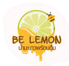
ภาพที่ 2 ร่างตราสินค้าผลิตภัณฑ์แปรรูปน้ำมะนาวพร้อมดื่มในจังหวัดเพชรบุรี

2. ด้านพฤติกรรมของผู้บริโภคในการตัดสินใจซื้อผลิตภัณฑ์แปรรูปน้ำมะนาวพร้อมดื่ม พบว่า กลุ่มตัวอย่างส่วนใหญ่ ชอบดื่มน้ำผลไม้พร้อมดื่ม หากต้องการซื้อผลิตภัณฑ์น้ำมะนาวพร้อมดื่มจะซื้อที่ร้านสะดวกซื้อ เพราะมีประโยชน์ต่อสุขภาพและ เห็นว่าบรรจุภัณฑ์ผลิตภัณฑ์น้ำมะนาวพร้อมดื่มที่จะเลือกซื้อควรเป็นแบบขวดแก้ว ขนาด 200 มล. บรรจุภัณฑ์ควรมีโทนสีเขียว สดุดที่กลุ่มตัวอย่างชื่นชอบคือ สูตรน้ำมะนาว ร้อยละ 80 น้ำตาล ร้อยละ 20 จำหน่ายในราคา 21 - 25 บาท และกลุ่มตัวอย่างส่วนใหญ่คิดว่าตราสินค้าแบบที่ 2 เหมาะสมกับผลิตภัณฑ์แปรรูปน้ำมะนาวพร้อมดื่มมากที่สุด