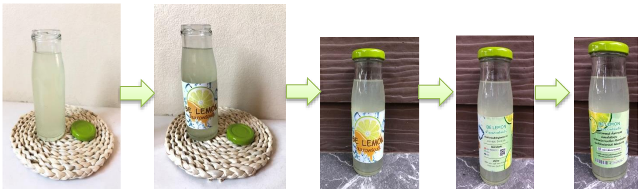
ภาพที่ 5 ต้นแบบผลิตภัณฑ์แปรรูปน้ำมะนาวพร้อมดื่ม ในจังหวัดเพชรบุรี

ซึ่งต้นแบบผลิตภัณฑ์แปรรูปน้ำมะนาวพร้อมดื่ม ใช้บรรจุภัณฑ์ประเภทขวดแก้ว โดยฉลากสินค้ามีขนาด 16.6 ซม. X 6.5 ซม. โทนสีเขียว แสดงข้อมูลตราสินค้า ชื่อ Be Lemon บริเวณกลางฉลาก พร้อมอธิบายได้ตราสินค้าน้ำมะนาวพร้อมดื่ม ฉลากด้านซ้ายมีการอธิบายประโยชน์ของน้ำมะนาว วิธีการเก็บรักษาและวิธีการรับประทาน แสดงปริมาณ 200 มล. มีเครื่องหมายการรับรองมาตรฐานคุณภาพสินค้า ด้านขวาแสดงชื่อตราสินค้า ส่วนประกอบโดยประมาณ ช่องทางการติดต่อ สถานที่ผลิต และสามารถสแกน QR Cord เพื่อดูรายละเอียดเพิ่มเติมเกี่ยวกับผลิตภัณฑ์ได้ โดยผลิตภัณฑ์แปรรูปน้ำมะนาวพร้อมดื่มจะจำหน่ายในราคาขวดละ 25 บาท ในช่วงเปิดตัวจะทดลองวางจำหน่ายที่ร้านขายของฝากในอำเภอท่ายาง จังหวัดเพชรบุรี และจัดกิจกรรมต่างๆ เพื่อส่งเสริมการขายและแจกผลิตภัณฑ์แปรรูปน้ำมะนาวพร้อมดื่มให้ทดลองชิม เพื่อเป็นการแนะนำและสร้างการรับรู้ในตัวผลิตภัณฑ์ใหม่ในตลาด