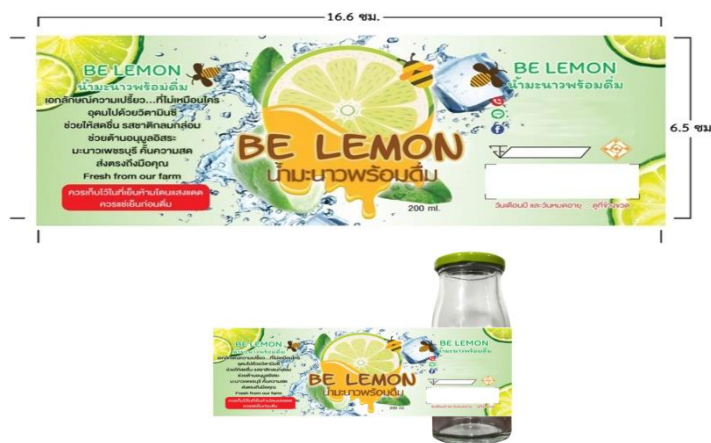
ภาพที่ 3 ร่างฉลากผลิตภัณฑ์ต้นแบบ ผลิตภัณฑ์แปรรูปน้ำมะนาวพร้อมดื่ม ในจังหวัดเพชรบุรี

จากการศึกษาพฤติกรรมและความต้องการของผู้บริโภค ที่มีต่อผลิตภัณฑ์แปรรูปน้ำมะนาวพร้อมดื่ม ในจังหวัดเพชรบุรี และการให้กลุ่มตัวอย่างทดลองชิมผลิตภัณฑ์ ผู้วิจัยจึงทำการพัฒนาร่างผลิตภัณฑ์ต้นแบบโดยใช้ฉลากสินค้าเป็นโทนสีเขียว มีขนาด 16.6 ซม. X 6.5 ซม. ซึ่งมีตราสินค้าเป็นรูปมะนาวผ่าเป็นแฉกบางๆ ด้านบนมีตัวผึ้งเกาะอยู่ ด้านซ้ายฝั่งบนจนถึงด้านล่างมีใบมะนาว ก้อนน้ำแข็งอยู่ด้านขวามือแสดงถึงความเย็นสดชื่น ด้านล่างตราสินค้าใส่ชื่อหือ Be Lemon น้ำมะนาวพร้อมดื่ม แสดงปริมาณใต้ตราสินค้า คือ ขนาด 200 มล. ด้านซ้ายของฉลากอธิบายประโยชน์ของน้ำมะนาว วิธีการเก็บรักษา และด้านขวาของฉลากมีช่องทางการติดต่อ วันเดือนปีที่หมดอายุและการรับรองมาตรฐานคุณภาพสินค้า ด้านบรรจุภัณฑ์ จากการศึกษาความต้องการของผู้บริโภค พบว่าผลิตภัณฑ์น้ำมะนาวพร้อมดื่มที่กลุ่มตัวอย่างต้องการซื้อและเหมาะสมกับผลิตภัณฑ์แปรรูปน้ำมะนาวพร้อมดื่มควรเป็นประเภทขวดแก้ว ขนาด 200 มล. และบรรจุภัณฑ์ควรมีโทนสีเขียว ผู้วิจัยจึงพัฒนาเป็นร่างผลิตภัณฑ์ต้นแบบ ดังนี้