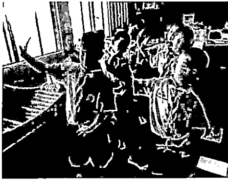
ภาพขั้นตอนการสอนปฏิบัติระบำชักพระ

4. ผลการประเมินหลักสูตร พบว่า นักเรียนมีผลการเรียนรู้เรื่องการใช้หลักสูตร แตกต่างกันอย่างมีนัยสำคัญทางสถิติที่ระดับ .05 โดยหลังการใช้หลักสูตรมีคะแนนเฉลี่ยสูงกว่าก่อนการใช้หลักสูตร ทั้งนี้อาจเป็นเพราะว่า หลักสูตรรายวิชาเพิ่มเติมเรื่อง ระบำชักพระ เป็นหลักสูตรที่พัฒนาขึ้นมาจากความต้องการของนักเรียน มีผู้รู้ ครูและผู้ที่เกี่ยวข้อง ซึ่งเป็นผู้ที่มีความรู้ มีประสบการณ์เกี่ยวกับประเพณีชักพระอย่างแท้จริง มาเป็นผู้ให้ความรู้แก่นักเรียน และใช้วิธีการจัดการเรียนการสอนที่หลากหลาย และเน้นการปฏิบัติ ซึ่งสร้างความสนใจให้กับผู้เรียน และมีกิจกรรมที่อาศัยความร่วมมือ ความมีระบบระเบียบวินัยและความรับผิดชอบของนักเรียนร่วมกัน จึงจะทำให้ประสบความสำเร็จ