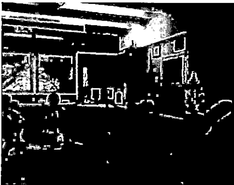
ภาพการแสดง ระเบียบราชพิธี

4. ผลการประเมินและปรับปรุงหลักสูตร รายวิชาเพิ่มเติมเรื่อง ระเบียบราชพิธี พบว่า คะแนนเฉลี่ย ผลการเรียนรู้เรื่องการปฏิบัติทำระเบียบราชพิธี ของนักเรียนก่อนการทดลองใช้หลักสูตรและหลังทดลองใช้หลักสูตร แตกต่างอย่างมีนัยสำคัญทางสถิติที่ระดับ .05 ซึ่งยอมรับสมมติฐานทางการวิจัย โดยคะแนนเฉลี่ย ผลการเรียนรู้หลังการทดลองใช้หลักสูตร ( X=10.08 , S.D.=1.94 ) สูงกว่าคะแนนเฉลี่ยการเรียนรู้หลังการทดลองใช้หลักสูตร ( X=15.65 , S.D.=1.13 ) 2) นักเรียนมีความสามารถในการปฏิบัติทำระเบียบราชพิธี อยู่ในระดับ ยอดเยี่ยม 3) นักเรียนมีความพึงพอใจต่อหลักสูตร รายวิชาเพิ่มเติมเรื่อง ระเบียบราชพิธี อยู่ในระดับ มากที่สุด