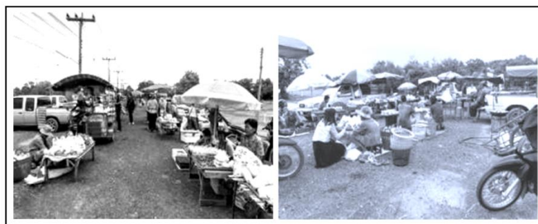
รูปที่ 2 ขั้นตอนที่ 3 การสังเกต (Observing)

วงจรที่ 3 : ขั้นตอนที่ 3 การสังเกต (Observing) หลักการที่สำคัญ ของขั้นตอนนี้ คือ “การสังเกตผลที่เกิดขึ้นจากการ ปฏิบัติจริง” โดยมีเป้าหมาย เพื่อให้ได้คำตอบเกี่ยวกับสิ่งที่คาดหวัง สิ่งที่ไม่คาดหวัง สิ่งที่ต้องปรับปรุง ข้อเสนอแนะ ของการ ปฏิบัติกิจกรรมการฟื้นฟูตลาด