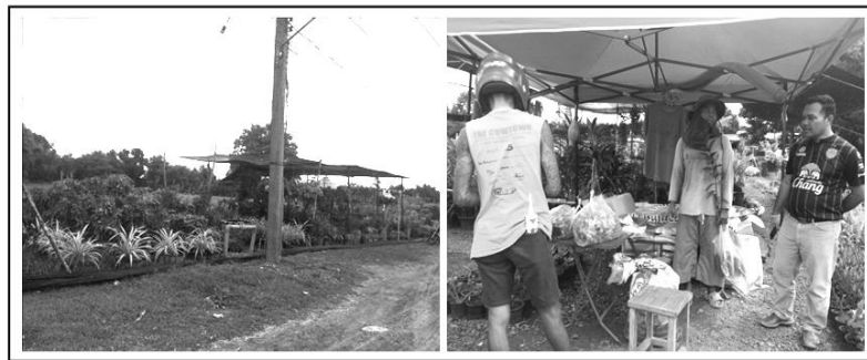
รูปที่ 3 ขั้นตอนที่ 3 ขั้นตอนที่ 6 การปฏิบัติใหม่ (Re-acting)

วงจรที่ 6 : ขั้นตอนที่ 6 การปฏิบัติใหม่ (Re-acting) หลักการที่สำคัญ ของขั้นตอนนี้ คือ “หลักการมุ่งเปลี่ยนแปลงและมุ่งให้เกิดการกระทำเพื่อให้บรรลุผล และหลักการรับฟังความคิดเห็นจากชุมชนตลอดจนเกิดกระบวนการเรียนรู้ร่วมกัน อย่างเป็นระบบ” การดำเนินการในขั้นตอนนี้ 6 ดำเนินการในระหว่างเดือน มิถุนายน 2562 – สิงหาคม 2562