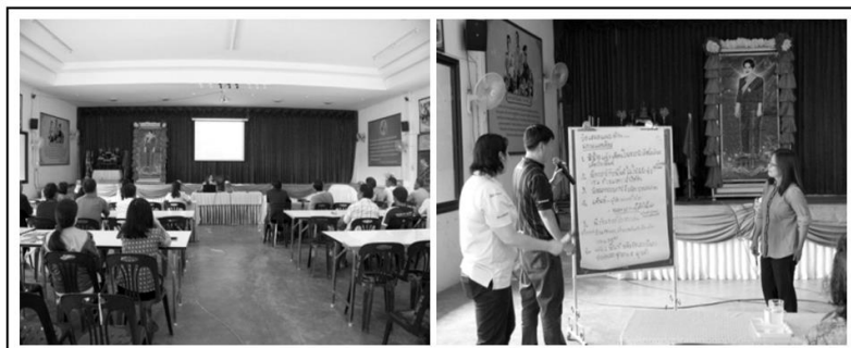
รูปที่ 4 ขั้นตอนที่ 8 การสะท้อนผลใหม่ (Re-reflecting)

วงจรที่ 8 : ขั้นตอนที่ 8 การสะท้อนผลใหม่ (Re-reflecting) ในขั้นตอนการสะท้อนผลใหม่ (Re-reflecting) ดำเนินการในวันที่ 5 กันยายน 2562 ณ ห้องประชุมองค์การบริหารส่วนตำบลบัวทอง ผู้วิจัยยังคงยึดถือหลักการที่สำคัญ คือ “หลักการรับฟังข้อคิดเห็น ข้อเสนอแนะ ระดมความคิด จากผู้ร่วมวิจัยทุกคน วิเคราะห์ วิวิจารณ์ วิพากษ์ และประเมินตนเอง ตลอดจนการเกิดกระบวนการเรียนรู้ร่วมกันอย่างเป็นระบบ”